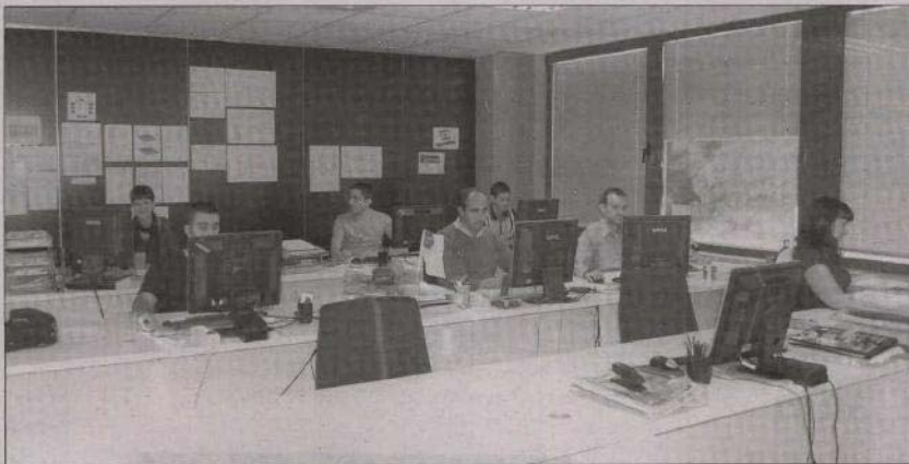
Instalaciones y trabajadores de la delegación de Inextrama en Valladolid.

INNOVACIÓN Y PROYECCIÓN EXTERIOR EN LAS EMPRESAS DE VALLADOLID