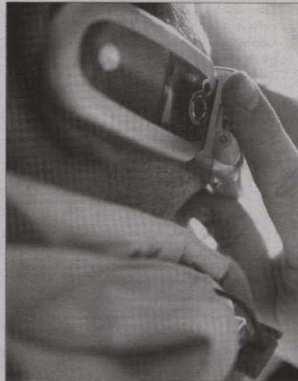
Un conductor usando el teléfono móvil por la Ronda Norte. / EL DÍA DE VALLADOLID

Uso del móvil. La última campaña de Tráfico destinada a vigilar la utilización del teléfono móvil por parte de los conductores sirvió para sancionar a 205 personas en dos semanas, lo que supone casi el 6% de los controles efectuados por la Guardia Civil en Valladolid